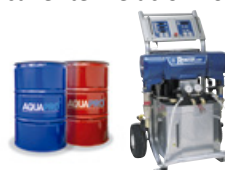
*EQUIPO DE PROYECCIÓN CALIENTE REACTOR E-XP2