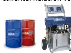
*EQUIPO DE PROYECCIÓN CALIENTE REACTOR E-XP2