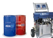
*ÉQUIPEMENTS DE PROJECTION À CHAUD REACTOR E-XP2

SYSTÈME UNIQUE AVEC D'INNOMBRABLES PROPRIÉTÉS D'ÉTANCHÉITÉ, RÉSISTANCE À LA TRACTION, L'ÉLONGATION, L'ATTAQUE CHIMIQUE, LA CORROSION, L'ABRASION OU LES IMPACTS. EN ÉTANT À LA FOIS COMPLÈTEMENT STABLE ET INALTÉRABLE, D'UN POINT DE VUE MÉCANIQUE, CHROMATIQUE ET ESTHÉTIQUE, FACE À L'EXPOSITION AUX INTEMPÉRIES (RAYONS UV)