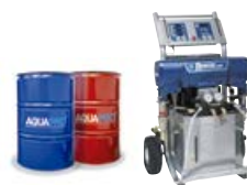
*EQUIPO DE PROYECCIÓN CALIENTE REACTOR E-XP2

| Nota Industrial: Coeficiente de riesgo por patologías del sistema derivadas de un mal uso, desprotección o vandalismo durante el proceso ejecutivo del proyecto, incomparablemente inferior a cualquier otro sistema de impermeabilización.