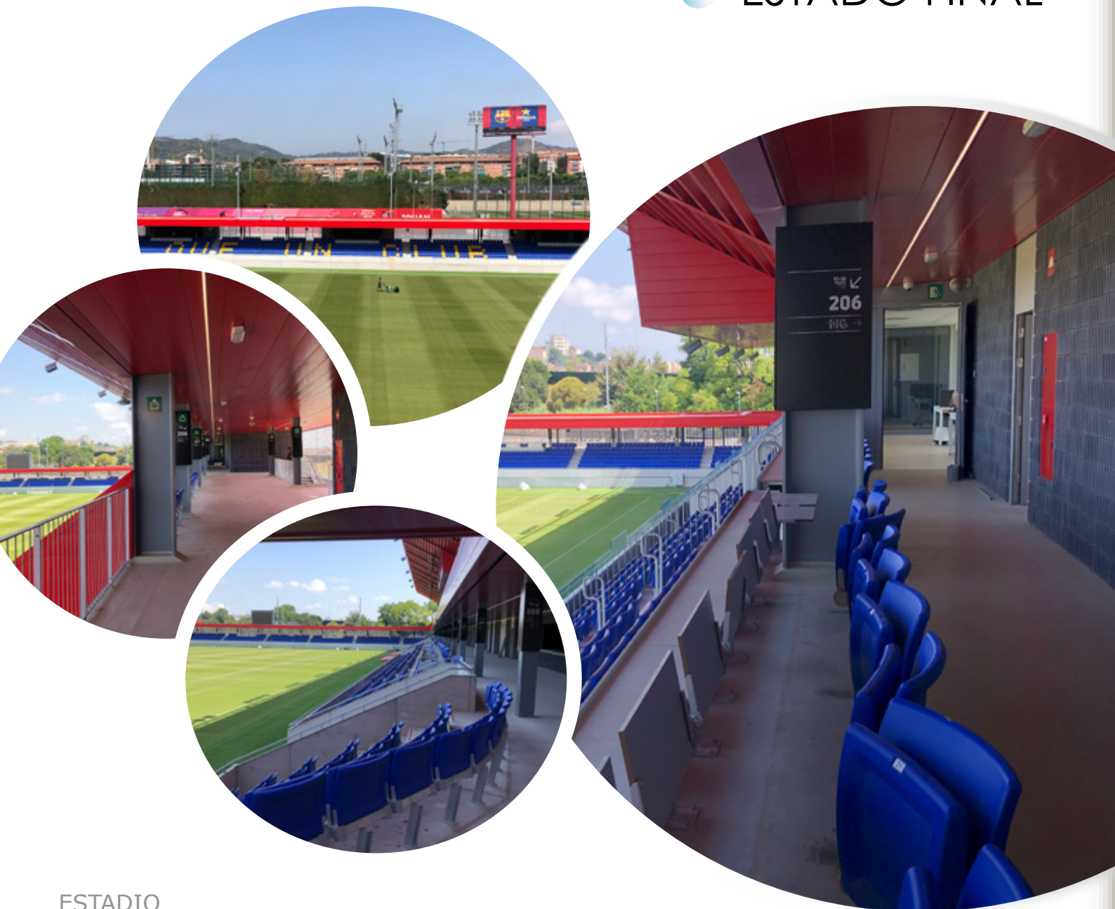
ESTADIO JOHAN CRUYFF F.C.B. Sant Joan Despí - Barcelona