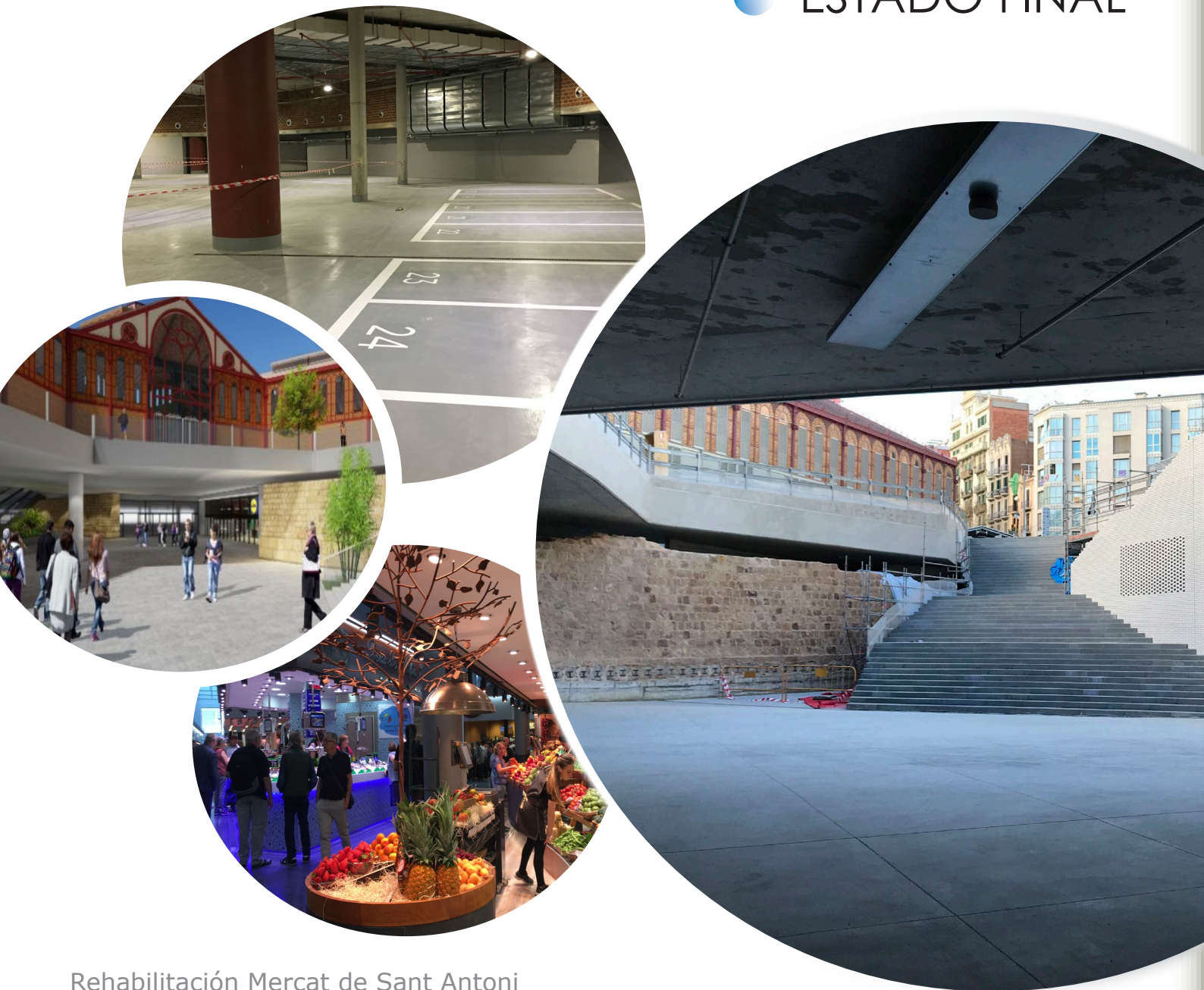
Rehabilitación Mercat de Sant Antoni C/ Comte d'Urgell, 1 - Barcelona